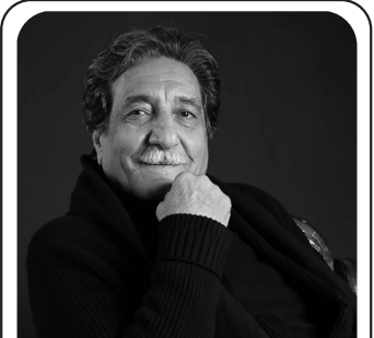
در گذشت دوبلور کارتون های «رایین هود» و «ماجراهای گالیور»